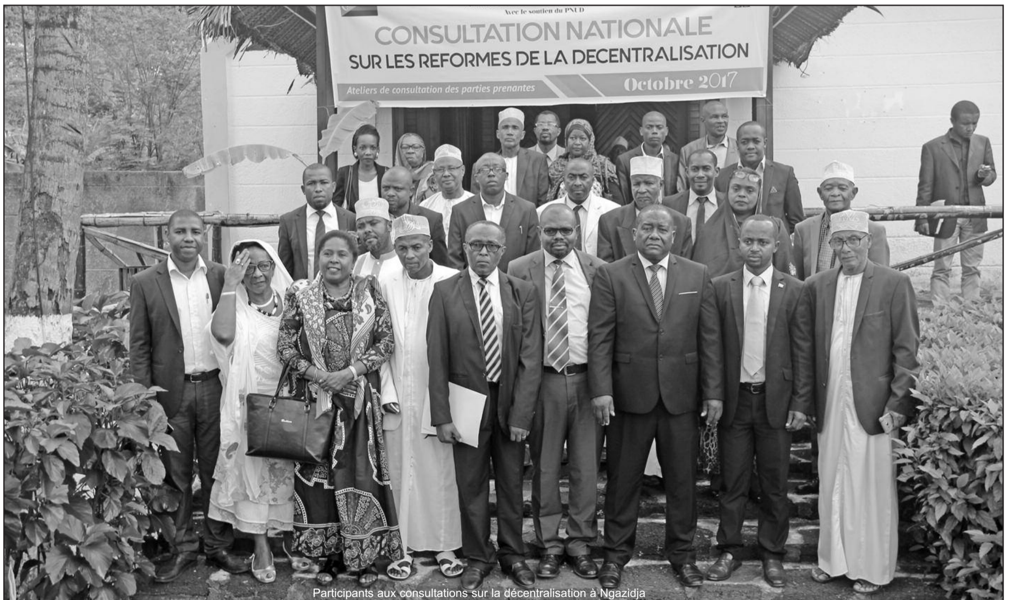
Participants aux consultations sur la décentralisation à Ngazidja

MANIFESTATION ANTI FEUILLE DE ROUTE À MAYOTTE :