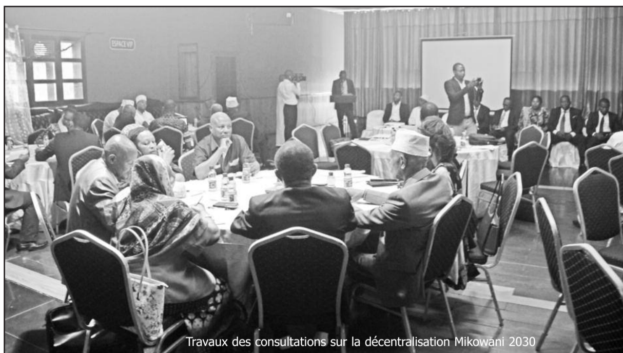
Travaux des consultations sur la décentralisation Mikowani 2030

« La mobilisation des forces vives de nos territoires au service du redressement ne suffit pas. Car aller jusqu'au bout de la logique de la constitution de 2001, révisée en 2009, ce n'est pas seulement transférer et décentraliser. C'est d'abord échanger et partager les expériences des uns et des autres et avec ceux qui ont les grandes pratiques en amplification locale et qui ont montré la maturité et la capacité des collectivités à développer les territoires