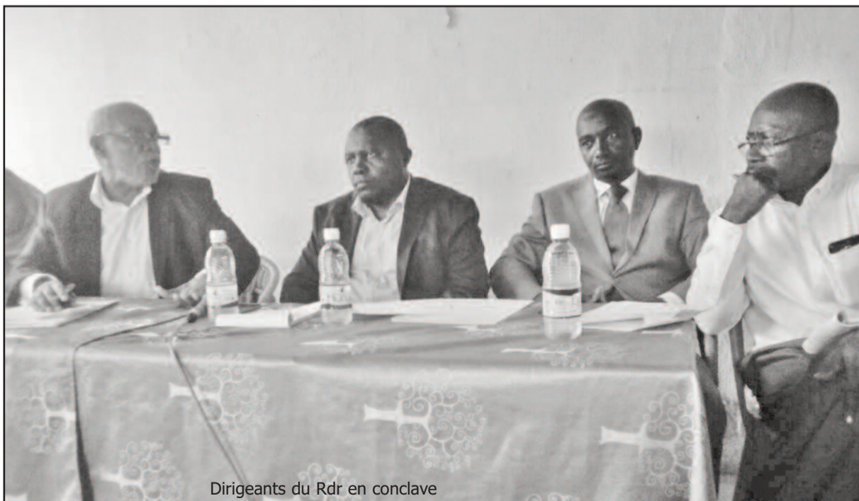
Dirigeants du Rdr en conclave