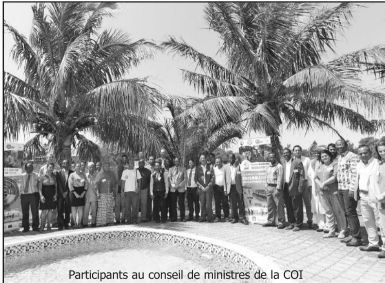
Participants au conseil de ministres de la COI

importante de la sécurité alimentaire qui fera l'objet d'une réunion ministérielle à Madagascar au mois de mars 2018. La Grande Ile, qui concentre plus de 90% des terres arables de l'Indianocéanie, est en effet au cœur de la stratégie régionale de sécurité alimentaire et nutritionnelle. « La COI, ne peut rester à l'écart des réalités qui gouvernent le monde. Elle doit s'inscrire dans